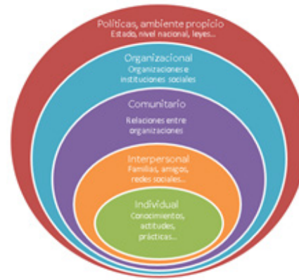
Figura 1: Modelo Socio-ecológico